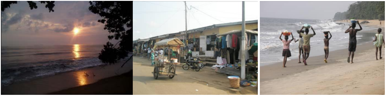
Puesta de Sol, centro e imágenes cotidianas de Kribi.