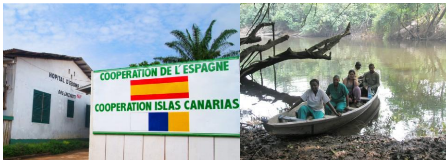
Ebome y traslado del personal a los campamentos Pigeos.