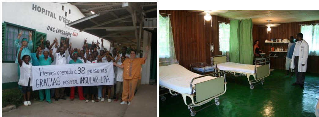
Diferentes áreas, etapas y personal del HEK