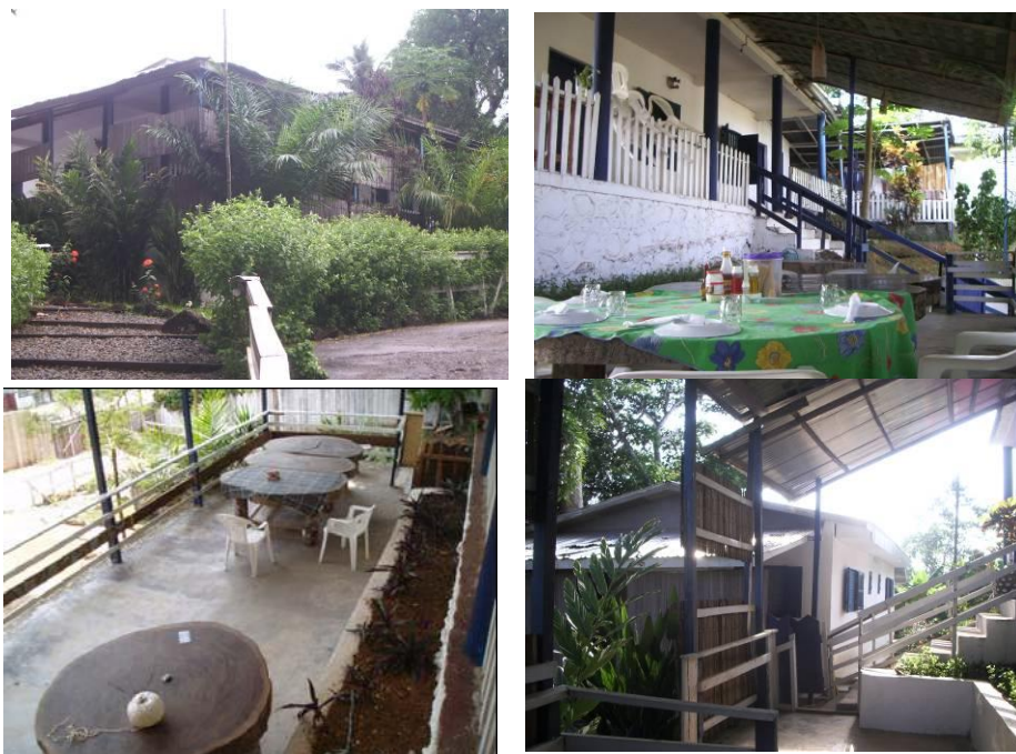
Frente de la casa de los voluntarios y terraza comedor de la misma.

La casa de la ONG, situada en el centro de Kribi, es una gran casa con un nivel de confort alto para el entorno. Tiene agua corriente (aunque no potable), electricidad (aunque los cortes son frecuentes en todo el país), teléfono fijo para recibir llamadas, acceso a Internet gratuito y habitaciones con baño propio. Cuenta además con personal local que se ocupa de proporcionar al voluntario los servicios básicos de limpieza, lavado y planchado de la ropa y cocina. La ONG se hace cargo también del transporte de los voluntarios por cuestiones laborales dentro del país.